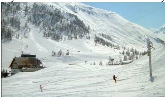
La fameuse scène du téléski - celui du Joseray