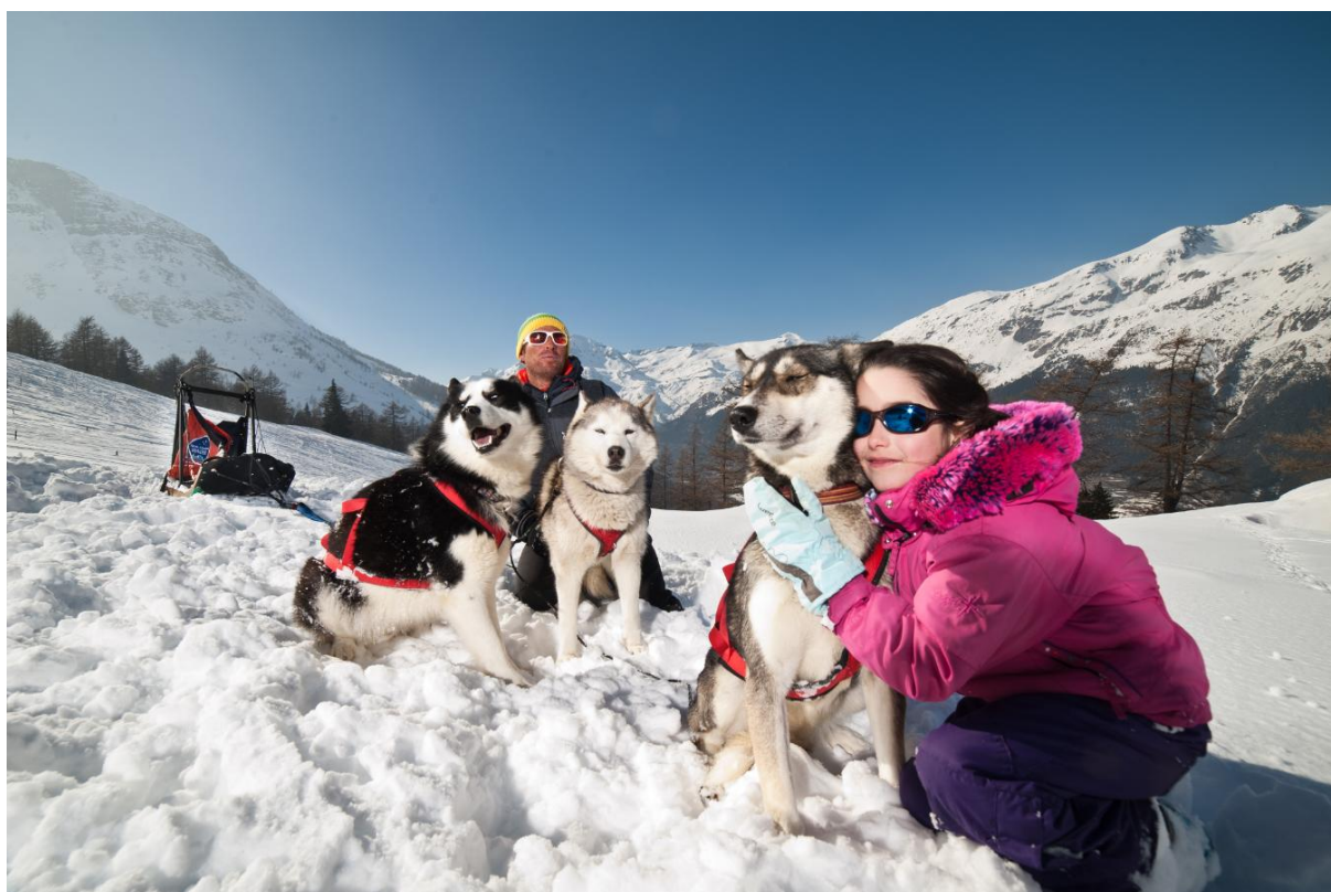
Huskysledetocht bij Val Cenis Vanoise

Dierenvrienden kunnen hun hart ophalen met een huskysledetocht of eens ski joering proberen. Bij het laatste word je voortgetrokken door paarden. Dit klinkt heftiger dan het is: kinderen vanaf 6 jaar die parallel kunnen skiën, kunnen het al doen. In Megève en Peisey-Vallandry vind je zelfs rendieren, in Gérardmer trekken honden kinderen door de sneeuw vooruit en in Valloire kun je (sneeuwschoen)wandelen met lama's.